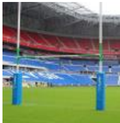
R9051 – Protections