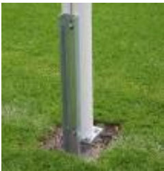
R9130 – Option Articulations