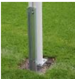
R9130 – Option Articulations