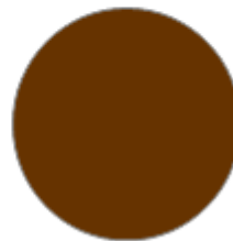
HAVANE (RAL 8016)