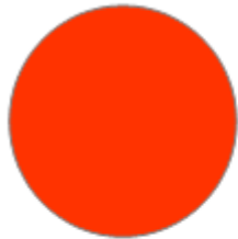
ROUGE (RAL 3020)