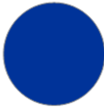
BLEUET (RAL 8204)