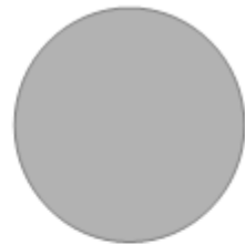
PIERRE (RAL 7030)