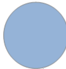
BLEU/GRIS (RAL 5008)