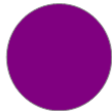
VIOLINE (RAL 4007)