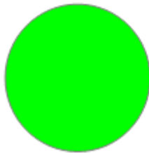
KIWI (RAL 6038)